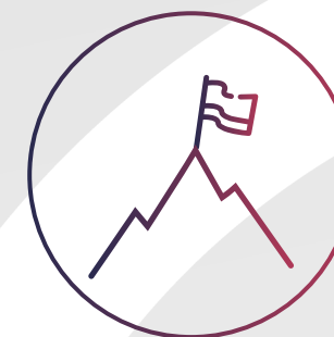
Образ успешного человека